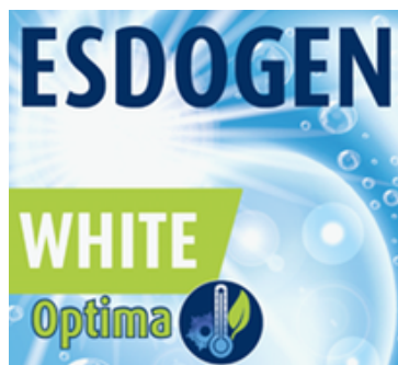
ESDOGEN White Optima

Lessive universelle efficace à basse température , idéale pour un nettoyage performant tout en réduisant la consommation d'énergie . Il combat les taches d'huile, de graisse et de pigments. Haute puissance dès 40°C.