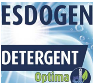
ESDOGEN Detergent Optima

Lessive universelle efficace à basse température , idéale pour un nettoyage performant tout en réduisant la consommation d'énergie . Il combat les taches d'huile, de graisse et de pigments. Haute puissance dès 40°C.