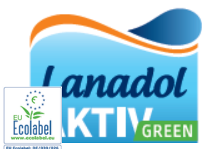
Lanadol AKTIV GREEN

Détergent écologique certifié Ecolabel UE, spécialement conçu pour nettoyer en douceur les textiles délicats tout en respectant l'environnement . Il protège les couleurs et efficacité à froid contre les taches de graisse et pigments.